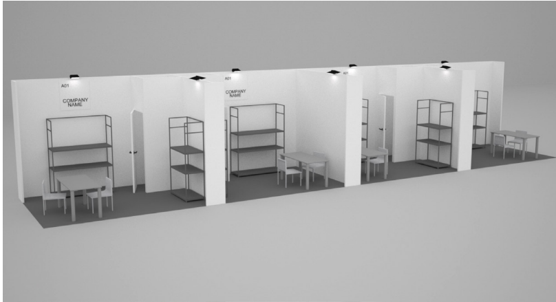
Immagine a solo titolo esemplificativo / Image is just an example

Scheda da inviare a / form to be sent to: segreteria@mipel.it