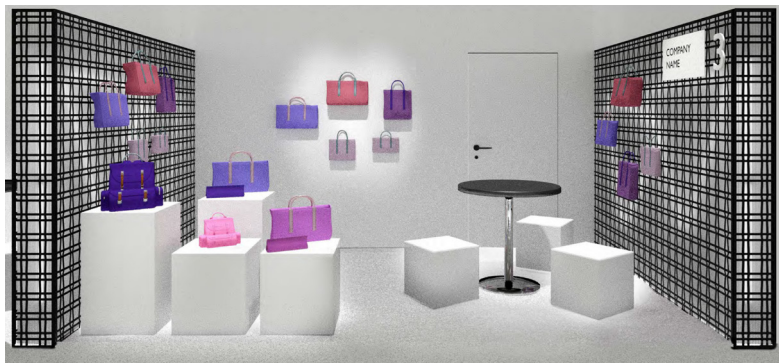
Immagine a solo titolo esemplificativo / Image is just an example

Scheda da inviare a / form to be sent to: segreteria@mipel.it