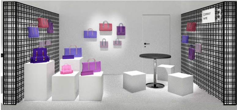
Immagine a solo titolo esemplificativo / Image is just an example

Scheda da inviare a / form to be sent to: segreteria@mipel.it