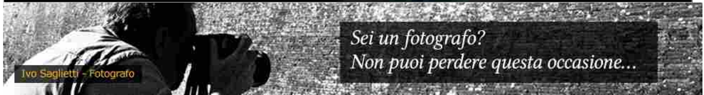
Ivo Saglietti - Fotografo