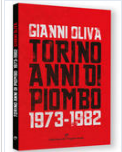
Torino Anni Di Piombo 1973-1982