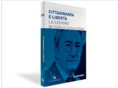
Cittadinanza E Libertà La Lezione Di Carlo Casalegno