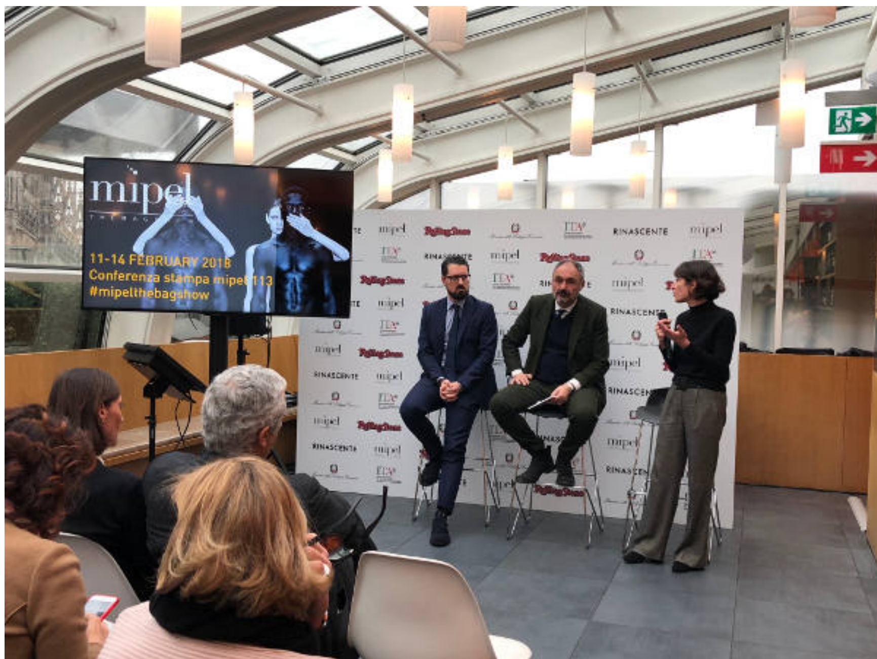
Un momento della conferenza di Mipel