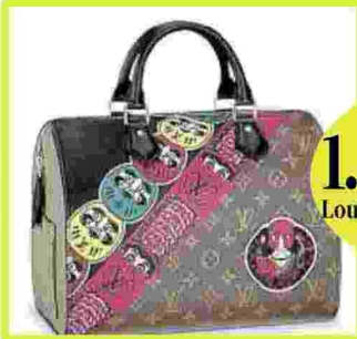
1.520 Louis Vuitton