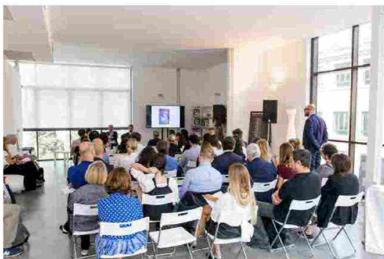
La conferenza stampa di Mipel 114