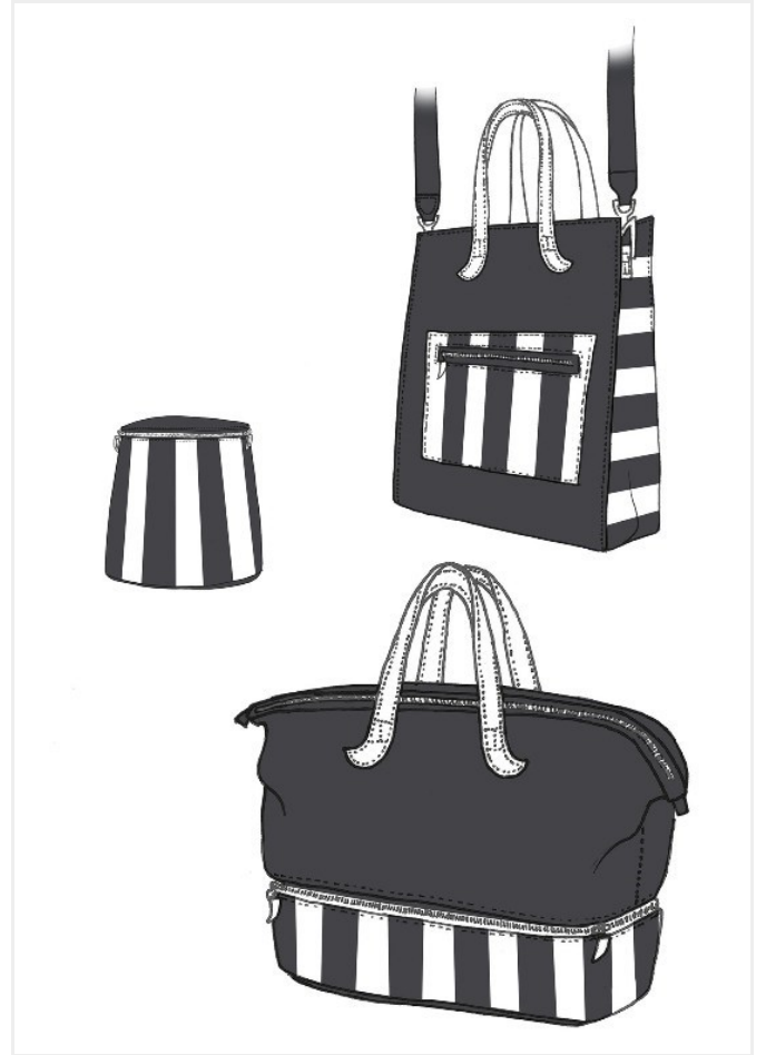
Uno schizzo della capsule di Laurafed e Tucano