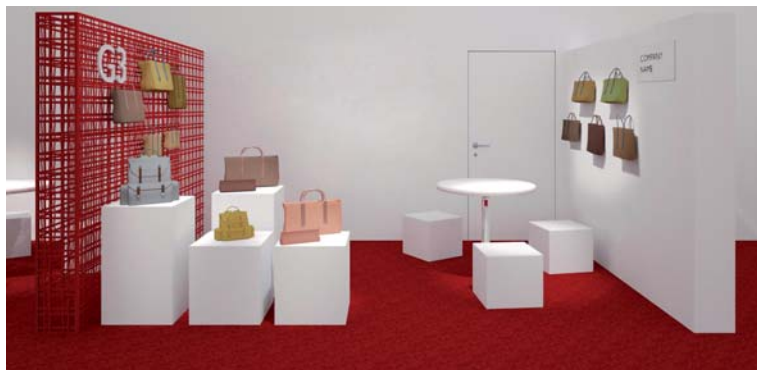
Immagine a solo titolo esemplificativo / Image is just an example

Scheda da inviare a / form to be sent to: segreteria@mipel.it