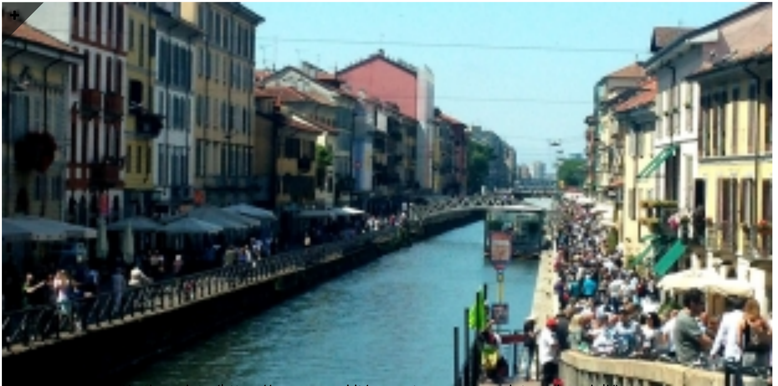
Il Mercatone dell'Antiquariato ( https://www.mymi.it/mercatone-antiquariato-sui-navigli/ )

Lo storico mercatino dell'antiquariato e del modernariato lungo il Naviglio Grande torna puntuale l'ultima domenica del mese!