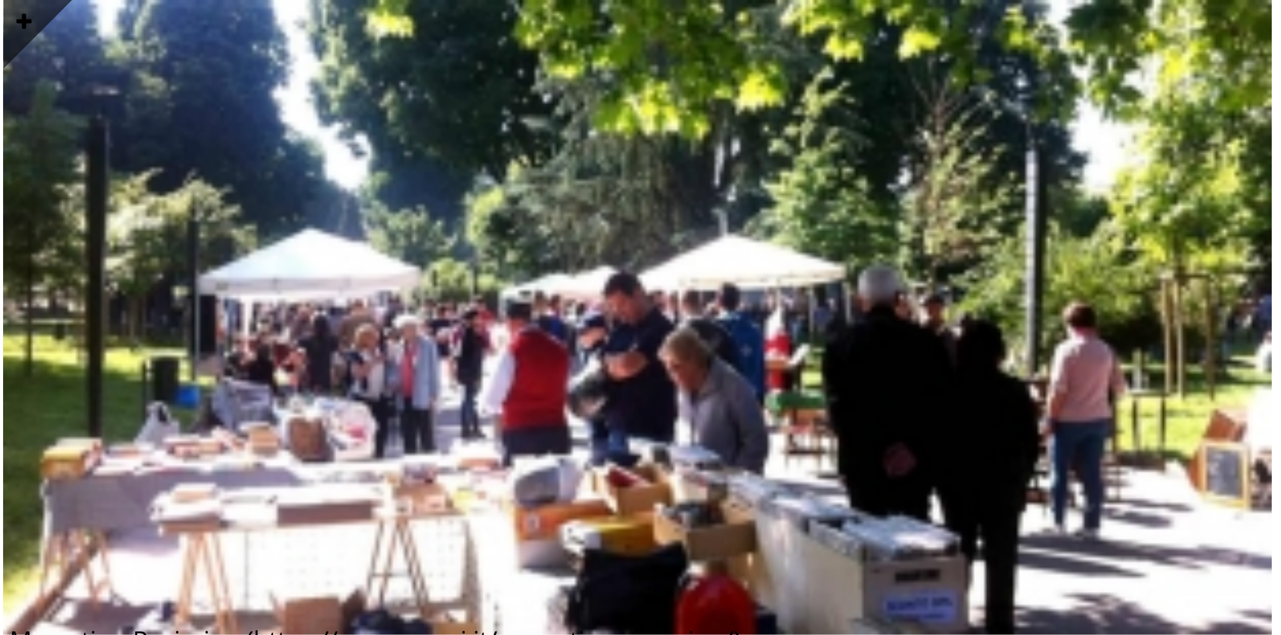
Mercatino Ravizzino ( https://www.mymi.it/mercatino-ravizzino/ )

Appuntamento dedicato a tutti gli hobbisti e ai collezionisti nella verde cornice del Parco Ravizza